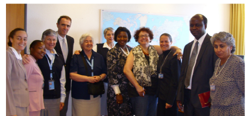
I membri di IIMA e VIDES incontrano l’UNCTAD

Infine, uno dei più importanti risultati ottenuti da IIMA e VIDES Internazionale nel corso di questo periodo è stato l’inizio della collaborazione con UNCTAD e Nazioni Unite direttamente in Haiti. Infatti, le efficaci azioni realizzate dalle FMA e dai volontari in Haiti, e in particolare la capacità di coordinare gli immediati aiuti umanitari, hanno spinto alti funzionari dell’UNCTAD e delle NU a confrontarsi coi i membri di IIMA su un piano d’azione comune per ricostruire il sistema educativo in Haiti.