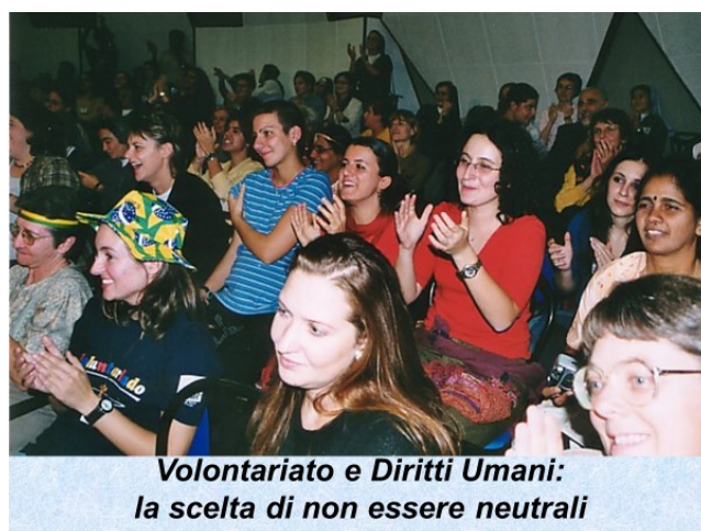
Volontariato e Diritti Umani: la scelta di non essere neutrali